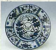
青花芙蓉手鳳凰文大皿:VOC製