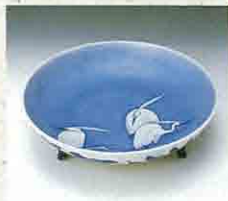
青花鶴文三腳皿 (鍋島藩窯) 重要文化財