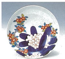
色繪石楠花杜鵑皿（鍋島藩窯）