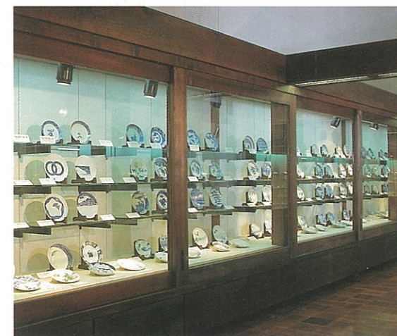
柴田夫妻珍藏品（大約展示1,200件）