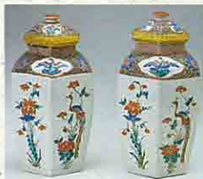
彩繪花鳥文六角壺 (柿右衛門式樣)