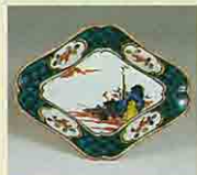
彩繪舟釣文隅入菱形皿 (1650~1660年代)