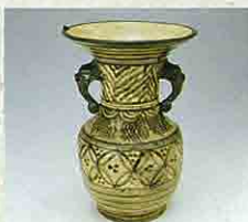
青花仿宋胡錄付耳花瓶 (薩摩・苗代川窯)