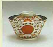
彩繪 赤玉瑠璃文付蓋碗 (1710~1750年代)