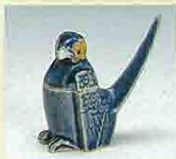
琉璃袖 鳥形香盒 (1630~1640年代)