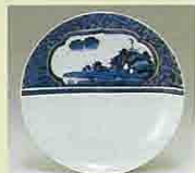
青花片身窗山水畫七寶繫文皿 (1650~1670年代)