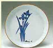
青花 菖蒲文皿 (1670~1690年代)