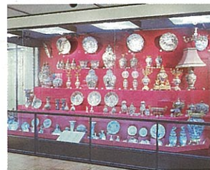
蒲原珍藏品（有田町寄託）

此室為陶瓷學習室，介紹陶瓷發展的歷史和特色。此外，蒲原珍藏品是集伊萬里輸出陶器之大成亦是本館的精華所在。