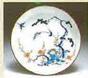
彩繪雙鳥梅文輪花皿 (1670~1690年代)