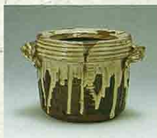
稻草灰流繪付耳水壺 (筑前・高取窯)