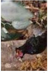
佐賀の森林ゾウマ