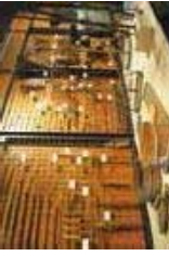
有明海漁捕用具(国指定重要有形民俗文化財)

佐賀県内の民俗資料を一堂に紹介しています。国指定の重要有形民俗文化財である有明海漁捕用具など、貴重なものではある貴重な資料を多数ご覧いただけます。