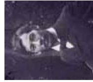
岡田三郎助 (明治39年撮影)

佐賀に生まれ、日本近代洋画の礎を築いた洋画家・岡田三郎助、師範の作品を中心に、その名品をご覧いただける常設展示室です。展示を通じて、岡田三郎助の画業や生涯、その芸術の素晴らしさをダイナミックにお伝えします。