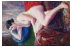
岡田三郎助「裸婦」(1917年) 佐賀県歴史文化局