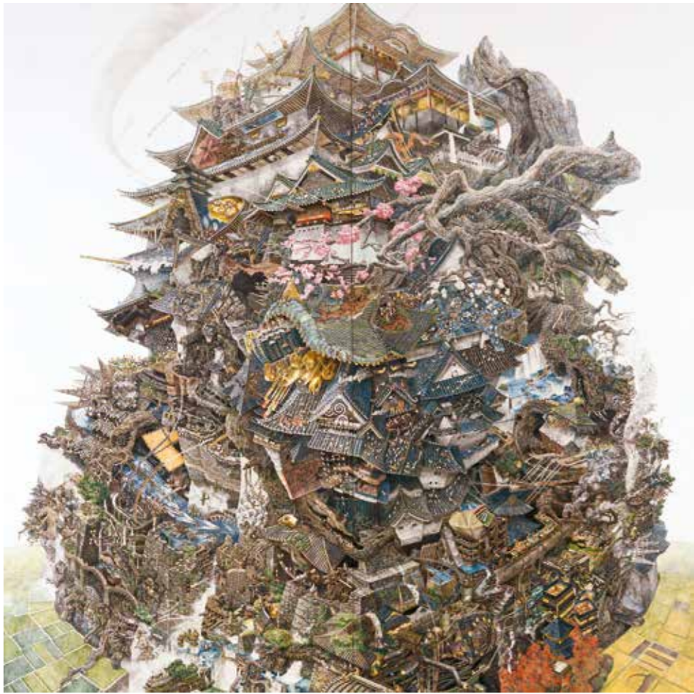
1 《興亡史》2006 200×200cm 高橋コレクション／ 2 《ニホンカモシカ》2006 30.7×22.5cm （公財）東京動物園協会発行「どうぶつと動物園」掲載 3 《予兆》2008 190×340cm 株式会社サステイナブル・インベスター所蔵／ 4 《カバ》2009 21.2×27.5cm （公財）東京動物園協会発行「どうぶつと動物園」掲載 5 《Gate》2010 22×27cm 個人蔵