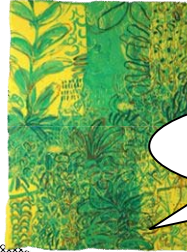
(左) 池田幸太郎「隅田川」館蔵 (右) 吉武研司「植物記—ふるさとの緑うるわし」館蔵