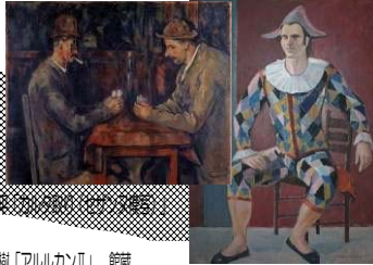
(左) 藤原隆雄「おたけ」個人蔵 (右) 萩原俊樹「アルカンII」館蔵