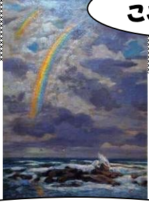
(左) 中沢弘光 「虹の海 (常陸磯原海岸)」館蔵 (右) 内山 孝 「夏の海 (パネチア)」館蔵