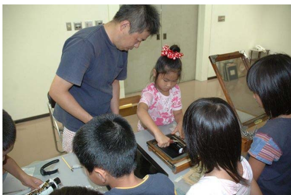
(すつたりおしたり)