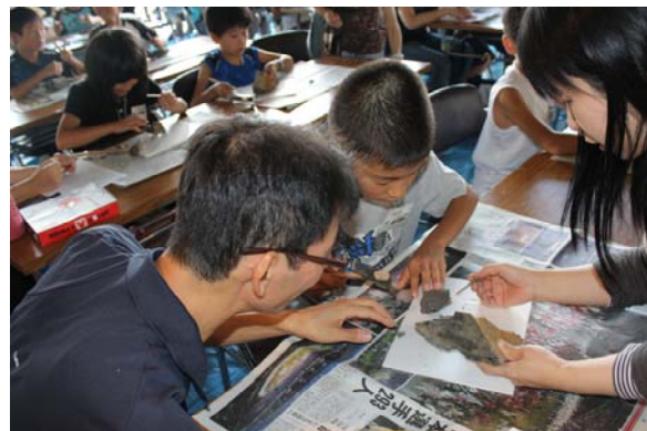
(化石クリーニング)