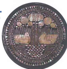
螺鈿蓮塘水禽文枕飾