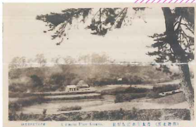
名護屋城跡の絵葉書