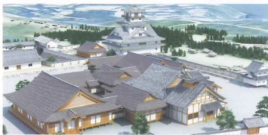
設計・監修: 西和夫・アルセッド建築研究所