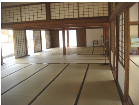
ヒント：【御座間・堪忍所】