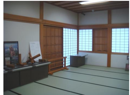
ヒント：【屯之間パズルコーナー】