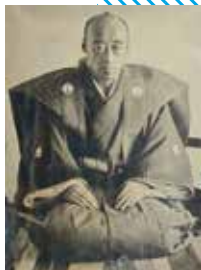
鍋島直正肖像写真