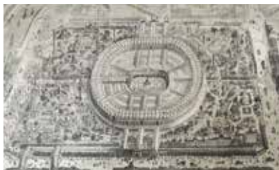
持ち帰り品のサラダ油 『L'Exposition Populaire Illustrée』所収 パリ万博会場