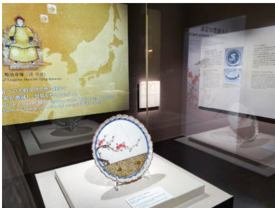
第1展示室 Room2 技術の革新