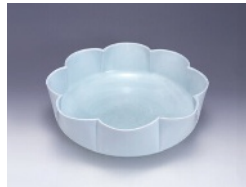
青白磁彫文花形花器 井上萬二 1985年 第82回 九州山口陶磁展 第1部第1位 文部大臣奨励賞

九州を代表する日本芸術院会員、重要無形文化財保持者(人間国宝)の作品を展示します。