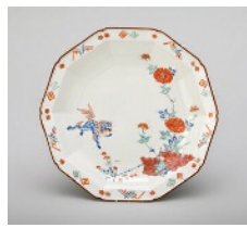
色絵唐獅子牡丹文十角皿 柿右衛門様式 肥前 有田 1670~1690年代 佐賀県重要文化財

有田焼の名品を映像や空間と組み合わせで紹介し、歴史や文化などのテーマごとに部屋を巡りながら、有田焼の背景に広がる多彩なストーリーをお楽しみいただけます。