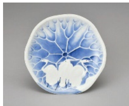
染付白蓮文変形皿 肥前 有田 1650年代頃 佐賀古澤家寄贈

令和5年度から6年度にかけて新たに収蔵した資料を展示。鍋島藩窯や現代作まで幅広く紹介します。