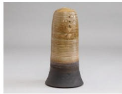
「弥生一帯の碑」 厚東孝治 2001年

前期:5月20日(火)~9月23日(火・祝) 後期:12月16日(火)~3月31日(火)