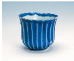
瑠璃釉鶴文輪花小鉢 肥前 有田 1610~1630年代 柴田夫妻コレクション