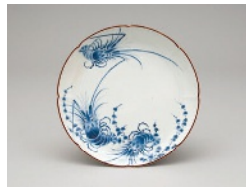
染付海老水草文輪花皿 肥前 有田 1670~1690年代 柴田夫妻コレクション