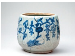
染付蔓草文水指 肥前 有田 1610~1630年代