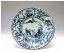
染付唐人山水文大皿 肥前 有田 1630~1640年代