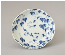
染付蕪文木瓜形小皿 肥前 鍋島藩窯 1780~1810年代