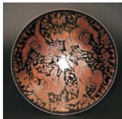
青木龍山「遊」 平成16年(2004年)作