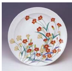
14代酒井田柿右衛門 灣手摺子文大皿 平成10年(1998年)作