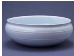
西山正 青白磁千段深鉢 平成7年(1995年)作 第92回九州山口陶磁展 文部大臣奨励賞

4月1日(木)~9月26日(日)、 12月21日(火)~1月30日(日) ※4月19日(月)-5月14日(金)、 9月27日(月)~12月20日(月)は除く