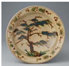
鉄絵緑彩松樹文大皿 佐賀県重要文化財 産地/肥前 武雄 年代/1620~1640年代 中島宏コレクション