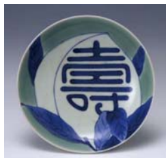
染付青磁桃文皿 産地/肥前 伊万里 鍋島藩窯 年代/1690~1730年代 白雨コレクション