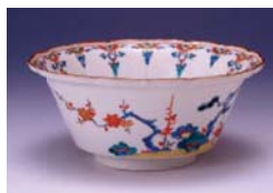
色絵松竹梅文輪花鉢(柿右衛門様式) 産地/肥前・有田 南川原山 1680~1700年代

4月1日(木)~11月28日(日)、 12月15日(水)~1月30日(日) ※11月29日(月)~12月14日(火)は除く