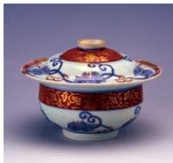
色絵牡丹唐草文蓋付鉢 産地/肥前 有田 年代/1695年(元禄8年銘) 工藤吉郎氏寄贈