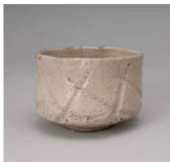
灰釉彫文茶碗 銘 玄海 佐賀県重要文化財 産地/肥前 年代/1580~1600年代 高取家コレクション