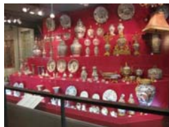
蒲原コレクション(有田町所蔵)