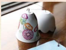
いい音色の有田焼の風鈴です ※写真はイメージです。

有田焼の風鈴に絵を描いたり、粘土細工をするなど、小さなお子様から大人まで気軽に体験できるイベントを開催します。