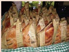
リンゴたっぷり「アップル・パイ」 ※写真はイメージです。