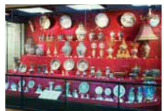
蒲原コレクション (有田町所蔵)

九州陶磁の学習室。やきものの種類や歴史、地区別の特色をわかりやすく紹介。また、蒲原コレクションの輸出伊万里は圧巻。