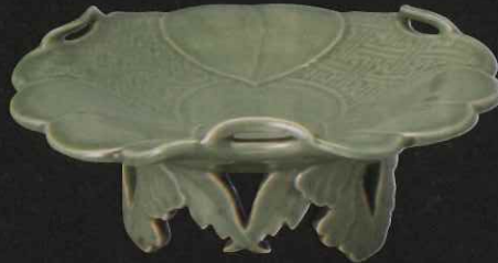
青磁紗綾形桃文台付皿 肥前 有田 1660-1680年代 / 口径 28.2cm 高 11.4cm