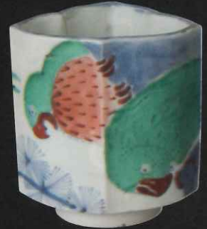
色絵鸚鵡文猪口 肥前 鍋島藩窯 1650-1660年代 / 口径 6.3cm 高 6.5cm