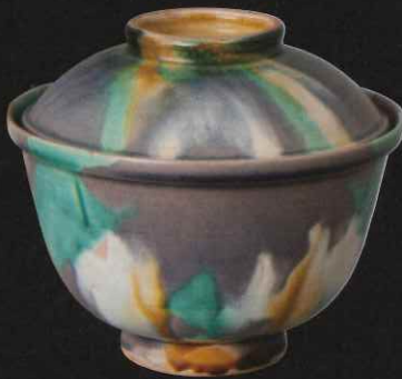
三彩蓋付碗 肥前 長与 1790-1820年代 / 口径 12.0cm 高 10.3cm