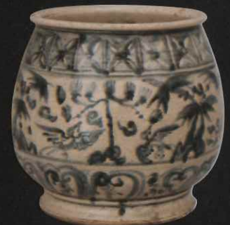
染付樹鳥文水指 ベトナム 16世紀後半-17世紀前半 / 口径 16.8cm 高 17.8cm