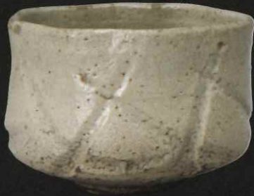
佐賀県重要文化財 灰釉彫文茶碗 銘 玄海 肥前 1580-1600年代 / 口径 14.2cm 高 10.1cm

展覧会では高取家コレクションの中から、唐津や有田、鍋島などの肥前陶磁を中心に、京焼、中国、朝鮮、ヨーロッパなど約180点の作品をご紹介します。