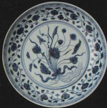
染付東蓮文大皿 中国 景德鎮 15世紀第14半期 / 口径 32.4cm 高 5.9cm