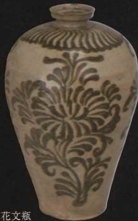
青磁鉄絵草花文瓶 朝鮮 12-13世紀 / 口径 5.6cm 高 26.0cm