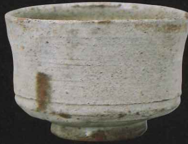
藁灰釉茶碗 豊前 上野 1590-1630年代 / 口径 12.8cm 高 8.3cm