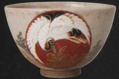
色絵日之出鶴文茶碗 京都 永楽保全 19世紀前半 / 口径 12.8cm 高 8.2cm