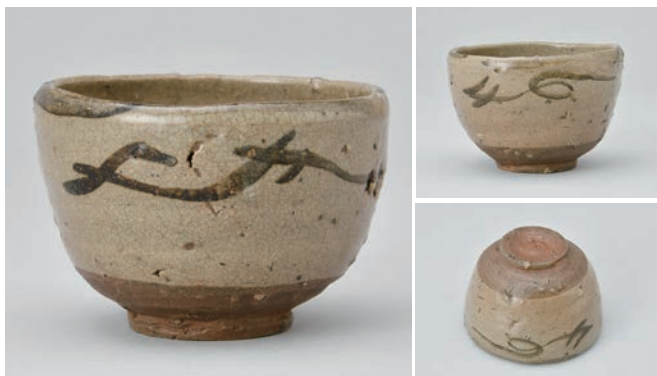
てつ え じもんわん 5 鉄絵やきもの字文碗

Bowl with character motif (yakimono) in underglaze iron brown