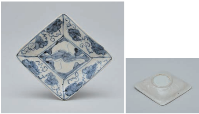
19 そめつけいちようぶどうもんひしがたござら 染付銀杏葡萄文菱形小皿

Small rhombic dish with ginkgo and grape design in underglaze cobalt blue