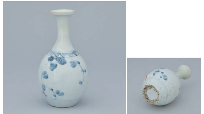
22 そめつけそう かもんびん 染付草花文瓶

Bottle with flowering plants design in underglaze cobalt blue