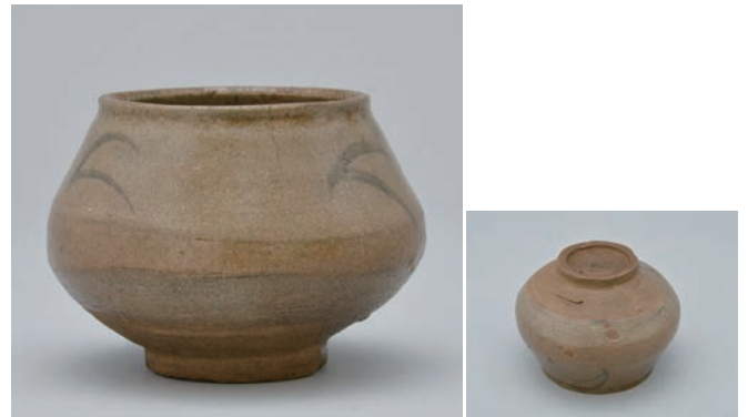
てつ え そうもん こつぼ 12 鉄絵草文小壺

Small jar with grass design in underglaze iron brown