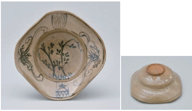
てつ え そうもん よ ほうざら 1 鉄絵草文四方皿

Square dish with grass design in underglaze iron brown