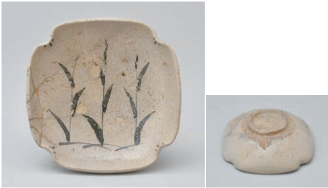
てつ え あしもん よ ほうざら 3 鉄絵葦文四方皿

Square dish with reed design in underglaze iron brown