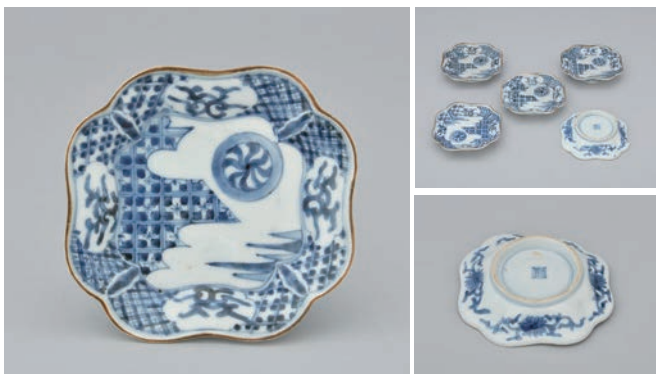
23 そめつけまるもん よほう ござら 染付丸文四方小皿 (5点)

Small square dish with circle design in underglaze cobalt blue