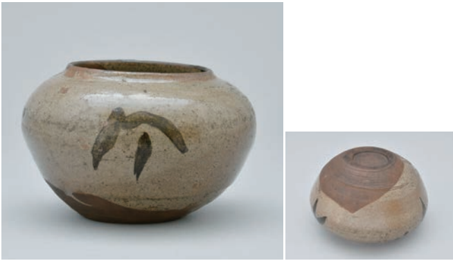
てつ え そうもん つぼ 9 鉄絵草文壺

Jar with grass design in underglaze iron brown