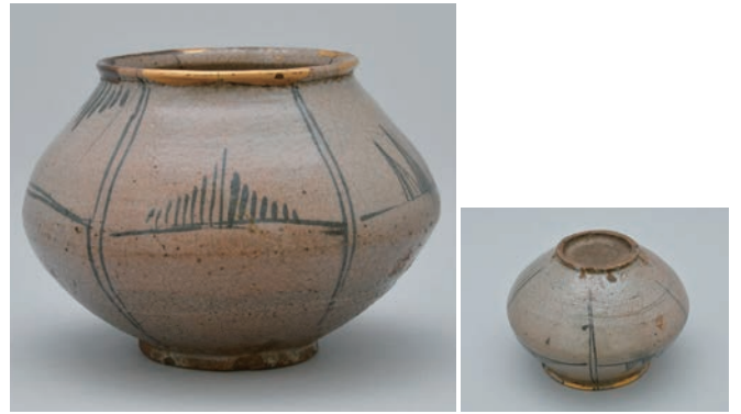
てつ え く かくもん つぼ 10 鉄絵区画文壺

Jar with panel design in underglaze iron brown