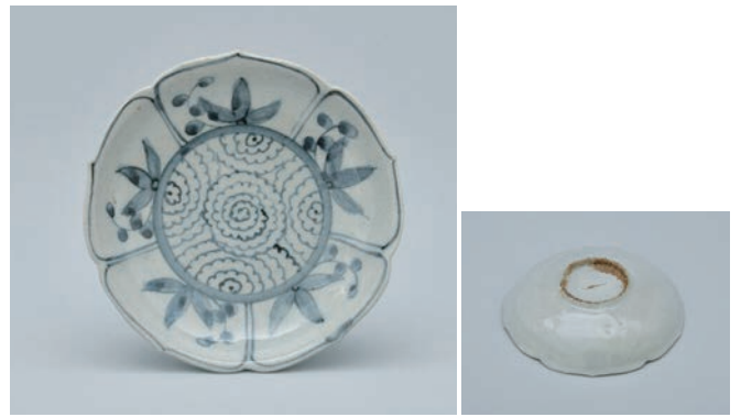
20 そめつけうん きもんりん か ござら 染付雲気文輪花小皿

Small lobed dish with stylized cloud design in underglaze cobalt blue