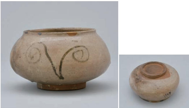
てつ え つるくさもん つぼ 11 鉄絵蔓草文壺

Jar with vine plant design in underglaze iron brown