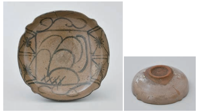
てつ え あしもん よ ほうざら 2 鉄絵葦文四方皿

Square dish with reed design in underglaze iron brown