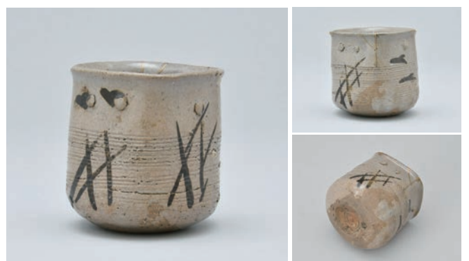
てつ え あしとりもんるいざ よ ほうちよく 6 鉄絵葦鳥文播座四方猪口

Square cup with bird and reed design in underglaze iron brown and applied dot ornament