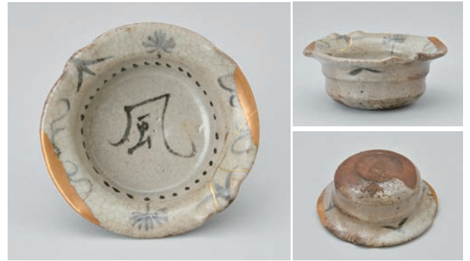
てつ え ふう じもんりん か こぼち 4 鉄絵風字文輪花小鉢

Small lobed bowl with character motif (fū) in underglaze iron brown