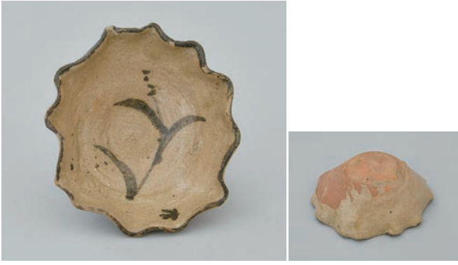
てつ え そうもん なみぶちし ようはい 7 鉄絵草文波縁小坏

Lobed small cup with grass design in underglaze iron brown