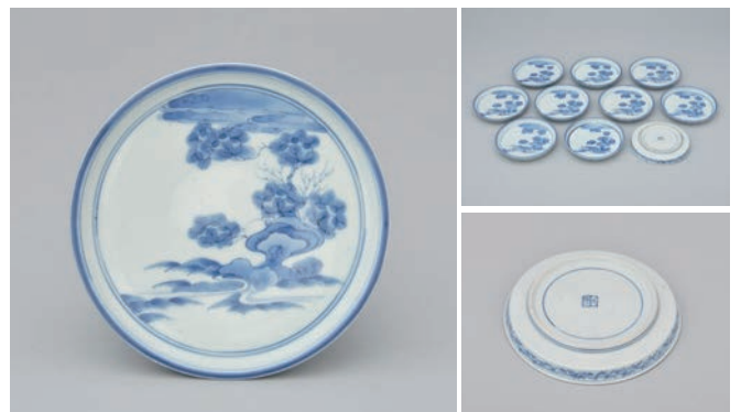
24 そめつけいわまつもん ござら 染付岩松文小皿 (10点)

Small dish with pine and rock design in underglaze cobalt blue