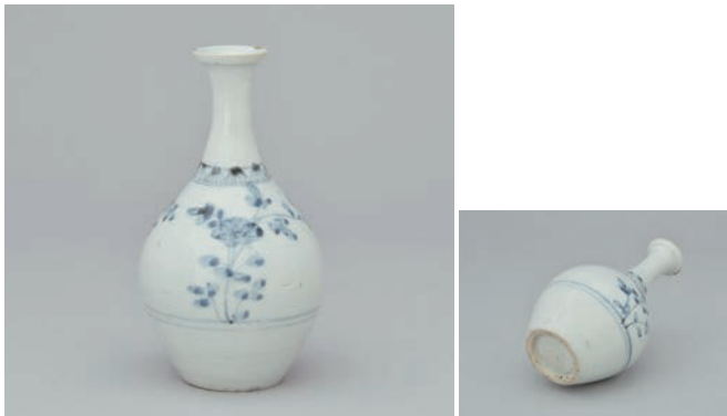
21 そめつけ か きもんびん 染付花卉文瓶

Bottle with flower design in underglaze cobalt blue