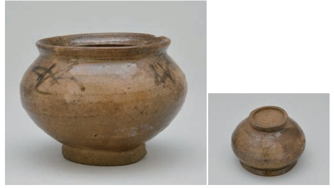
てつ え つぼ 8 鉄絵壺