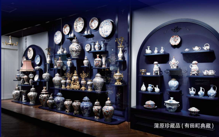
蒲原珍藏品 (有田町典藏)