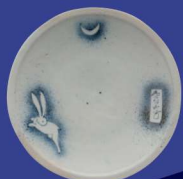
染付吹墨月兔文皿 (1630~1649年)