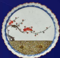
色绘梅牡丹唐草文轮花皿 (1650~1669年)

日本瓷器诞生于江户时代初期的有田一带,并在拥有优质陶石且受到佐贺藩保护管理的背景下逐渐发展。