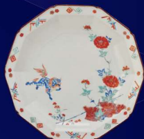
色绘唐狮子牡丹文十角皿 (1670~1699年)