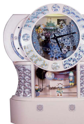
有田烧机关钟 (展厅)