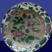
色绘牡丹鸟文大皿 (1650~1659年前后)