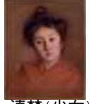
岡田三郎助 清楚(少女) 館蔵

OKADA-ROOM ・Vol. 14 6月21日(金)~11月14日(木) [展示室]美術館 OKADA-ROOM 【観覧料】無料 「岡田三郎助名品選~館蔵女性画を中心に~」 岡田三郎助作品の中でも特に人気の高い、美しく上品な女性画の数々を紹介いたします。 岡田三郎助 清楚(少女) 館蔵 ・Vol. 15 11月23日(土祝)~2月24日(月祝) 岡田三郎助アトリエとあわせて御覧ください