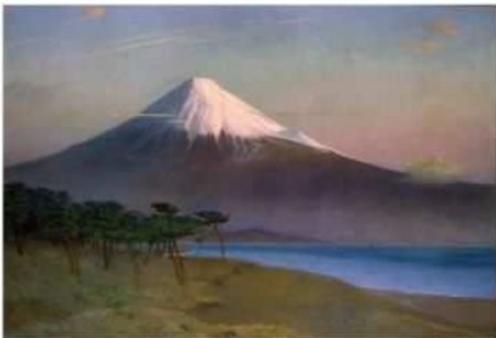
岡田三郎助《富士山(三保にて)》 1920(大正9) 油彩・カンヴァス 佐賀県立美術館

■内容 暗い色調を用い、優れた写実表現によって人物を描いた《矢調べ》(明治26年)をはじめ、雄大な山の描写に繊細な色の変化を見て取ることが出来る《富士山(三保にて)》(大正9年)、人体の質感と背景の鮮やかな色彩の調和が見事な《裸婦》(昭和10年)など、最初期から円熟期に至る作品を通して、岡田が画家として追い求めた表現の変遷を紹介。〔展示数17点〕