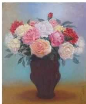
岡田三郎助《薔薇》1931年(昭和6年) 油彩・カンヴァス、佐賀県立美術館