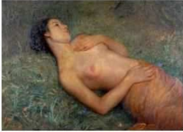
岡田三郎助《花野》 1917(大正6) 油彩・カンヴァス 佐賀県立美術館 佐賀県重要文化財

■内容 日本の裸婦像を代表する岡田の名品《花野》をはじめ、岡田がこよなく愛した長野県飯綱町の桃園を描いた《丹霞郷》、満開の八重桜が瑞々しい山口亮一の《桜》、武藤辰平によるフランス絵画の模写《春(ミレー模写)》等々を展示。〔展示数15点〕