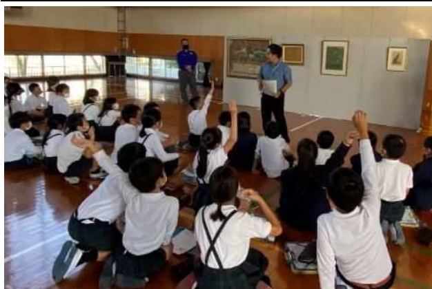
「美術作品鑑賞」の様子