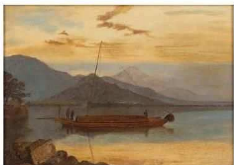
百武兼行《田子の浦図》1876年(明治9年) 油彩・カンヴァス、佐賀県立美術館

■内容 岡田三郎助を中心に6人の画家の優品を展示。併せて、現在を生きる作家3人の作品として、池田学《誕生》のスピノフ作品「鶴」や、岡田三郎助アトリエに着想した鶴友那・仁戸田典子の作品(平成30年度実施のアーティスト・イン・レジデンスにて制作)も紹介。〔展示数 13 点〕