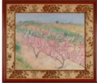
岡田三郎助《丹霞郷》 1933(昭和8) 油彩・カンヴァス