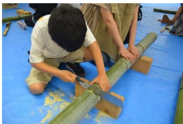
竹で食器をつくろう