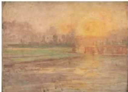
岡田三郎助《夕陽》1894年頃(明治27年頃) 油彩・板、個人蔵

■内容 岡田三郎助 が描いた 《夕陽》のような画面全体が光に包まれたような作品から、ラファエル・コランによる木陰から漏れる光に照らされた女性像の《日だまり》等、光を活かした作品を展示。 〔展示数 19 点〕