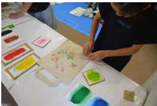
ハンを使って布を染めよう