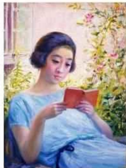
岡田三郎助《少女読書》1924年(大正13年) 油彩・カンヴァス、佐賀県立美術館