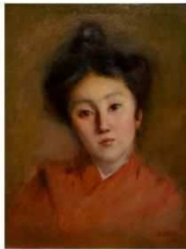
岡田三郎助《清楚(少女)》 1907(明治40) 油彩・カンヴァス 佐賀県立美術館