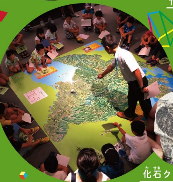
か せき 化石クリーニング