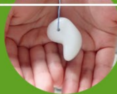
まが たま 勾玉をつくろう