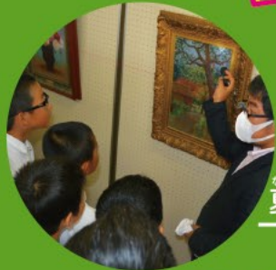
なつ びじゅつかん たん けん 夏のわくわく美術館探検!!