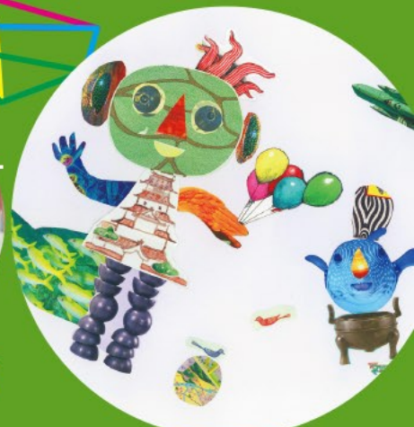
“コラージュ”でアート作品をつくろう