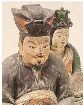
神像 佐賀県立博物館蔵

今回の講座では、博物館に収蔵されている仏像を中心に、実際に手にふれながら学びます。