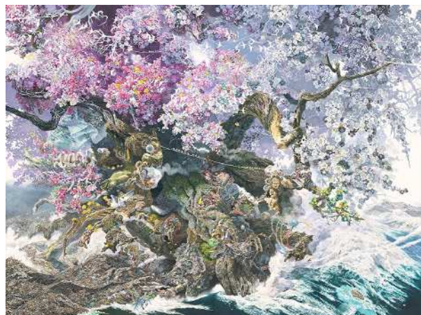
池田学《誕生》 佐賀県立美術館蔵

収蔵コレクションからピックアップした作品について、見どころや秘密を紹介しながら授業に役立つ美術鑑賞のポイントについて考えてみます。