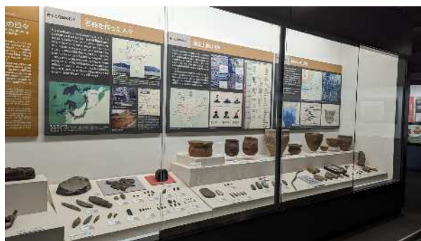
博物館常設展示の考古資料