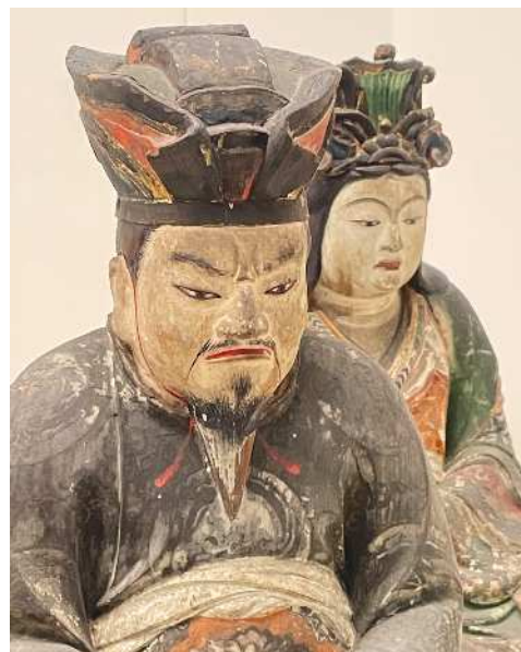
神像 佐賀県立博物館蔵

今回の講座では、博物館に収蔵されている仏像を中心に、実際に手にふれながら学びます。