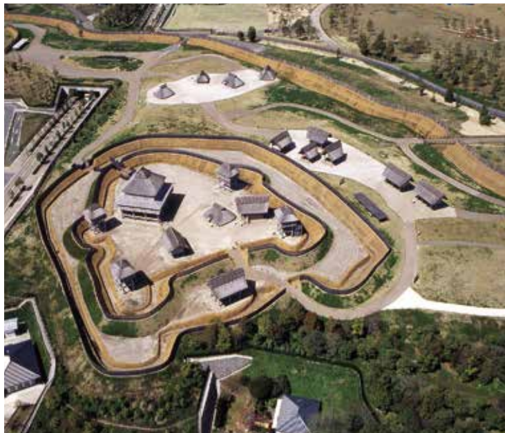
復元された北内郭(東から)