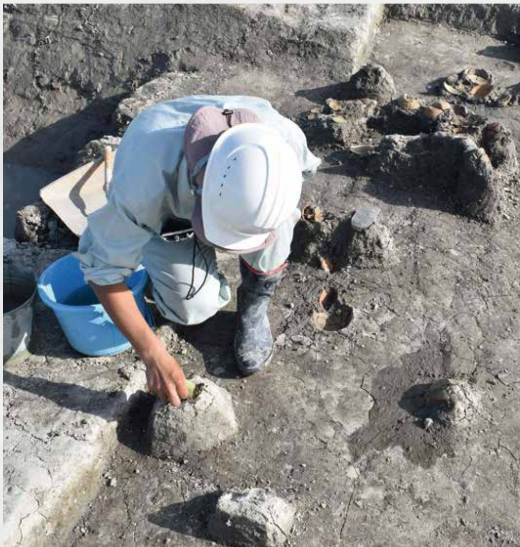
藤三郎屋敷(佐賀市)の発掘調査の様子