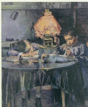
黒田清輝《洋燈と二児童》 1891年(ひろしま美術館蔵)