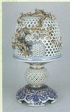
第1回国勧業博覧会出品 《染付上絵菊梅樹貼花文透彫鳥籠》 (財団法人鍋島報効会蔵)