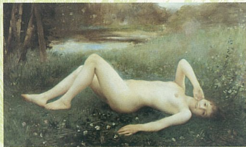
ラファエル・コラン《花月(フロレアル)》1886年(東京藝術大学大学美術館蔵)