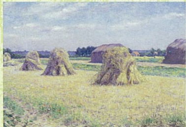
久米桂一郎《秋景》1892年(愛知県美術館蔵)