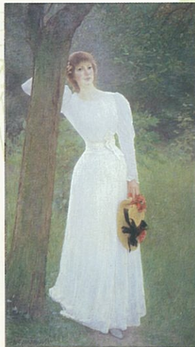
ラファエル・コラン《若い娘》 1894年(福岡市美術館蔵)