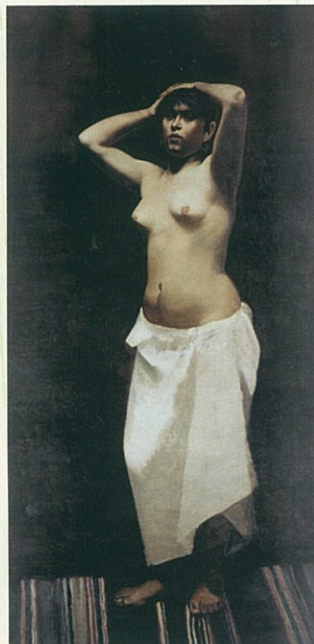
百武兼行《裸婦立像》 1881年頃(神奈川県立歴史博物館蔵)