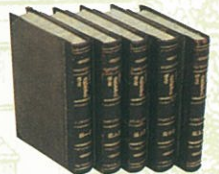
『米欧回覧実記』 (佐賀県立佐賀城本丸歴史館蔵)