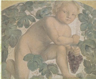
久米桂一郎「模写 ルイニ筆《小児と葡萄》」1892年(東京藝術大学大学美術館蔵)