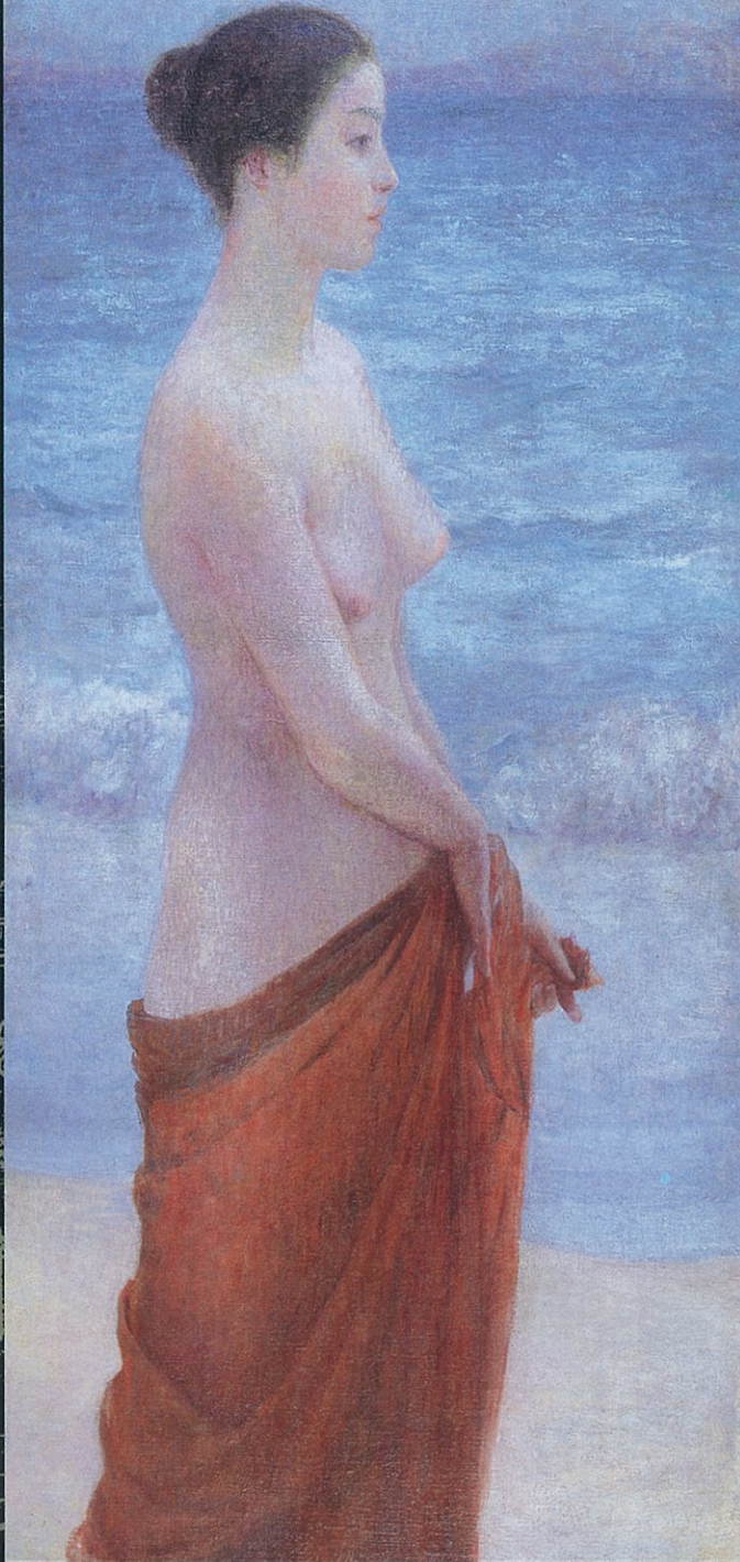
岡田三由雄「海外渡り」1914年 親和銀行蔵