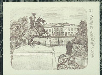
岡田三由雄「海外渡り」1914年 親和銀行蔵