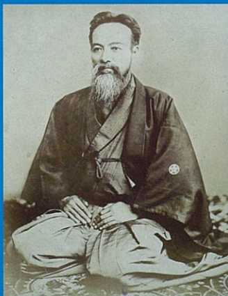
山岡鉄舟写真