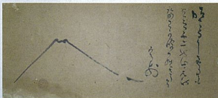
富士山図並和歌 山岡鉄舟筆 永楽屋(伊万里市)蔵