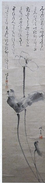
蓮華の画 山岡鉄舟筆・高橋泥舟賛 全生庵蔵

●鉄舟と勝海舟(1823~99)、高橋泥舟(1835~1903)の三人。 ●三人とも幕臣で武芸と書に優れた密接な関係にあった。 ●鉄舟を伊万里県権令に推薦したのは海舟。 ●泥舟は山岡家の次男で高橋家へ養子。鉄舟と義理の兄弟。