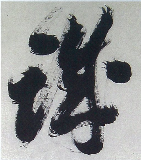
誠（「至誠如神」のうち）山岡鉄舟筆 全生庵蔵