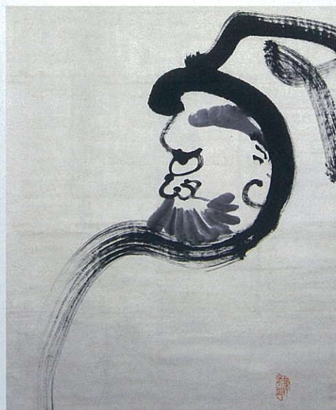
達磨図(部分) 山岡鉄舟筆 全生庵蔵