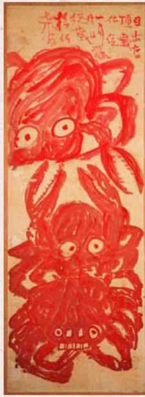
◆ 蟹図屏風(小城公民館展示)