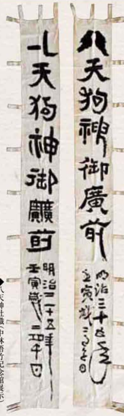
◆ 八天狗社幟(中林梧竹記念館展示)