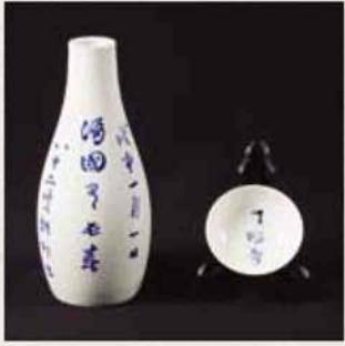
◆ 徳利、盃(中林梧竹記念館展示)