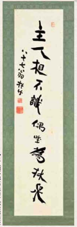
◆ 主人相不識(中林梧竹記念館展示)