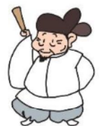
とよとみ ひでよし 豊臣 秀吉

きのしたのぶとし つま 「木下延俊」は、わしの妻「おね」の おい あに 甥(兄のこども)なんじゃ！