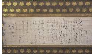
豊臣秀吉自筆書状