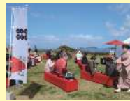
主催：佐賀県、唐津市

日本最大級のお城の 祭典「お城EXPO」の 出張版と名護屋城ゆ かりの文化を楽しむ 「名護屋城大茶会」を コラボ開催！