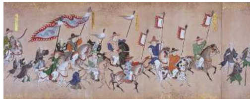
朝鮮通信使行列絵巻(部分)

江戸時代に12回来日した朝鮮通信使。数十年に一度の通信使を迎えた日本人々や滞在中の使節の想いを館蔵資料からたどります。