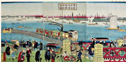
東京高輪海岸蒸気車鉄道図 (本館蔵)