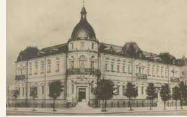
三菱二号館 (『明治大正建築写真聚覧』より)