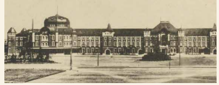
東京駅 (『明治大正建築写真聚覧』より)