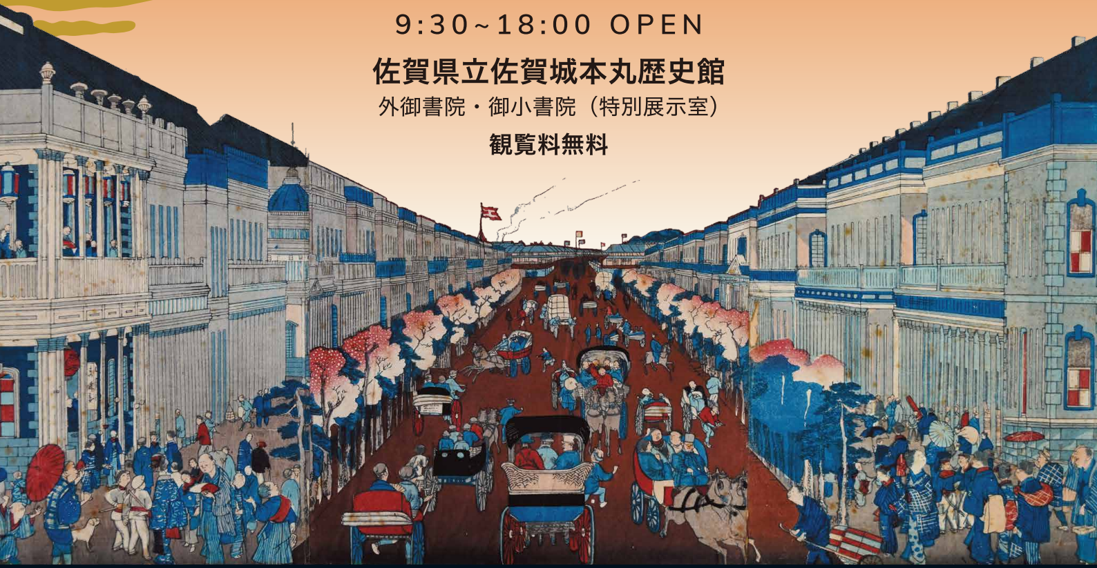
第一大区従京橋新橋芝罘瓦石造商家蕃昌貴賤敷次盛泉(個人蔵)