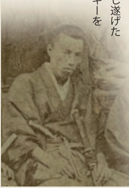
明治2年頃の大隈重信

本展覧会では、大隈と鉄道との関わりを国の重要文化財を含む貴重な一次資料や多彩なグラフィック、映像などを交えてご紹介します。わが国未曾有の大事業であった鉄道建設を成し遂げた大隈のエネルギーを感じ取ってください。