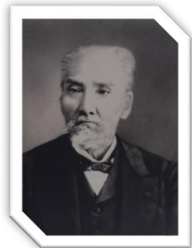
そえじまたねおみ ③副島種臣